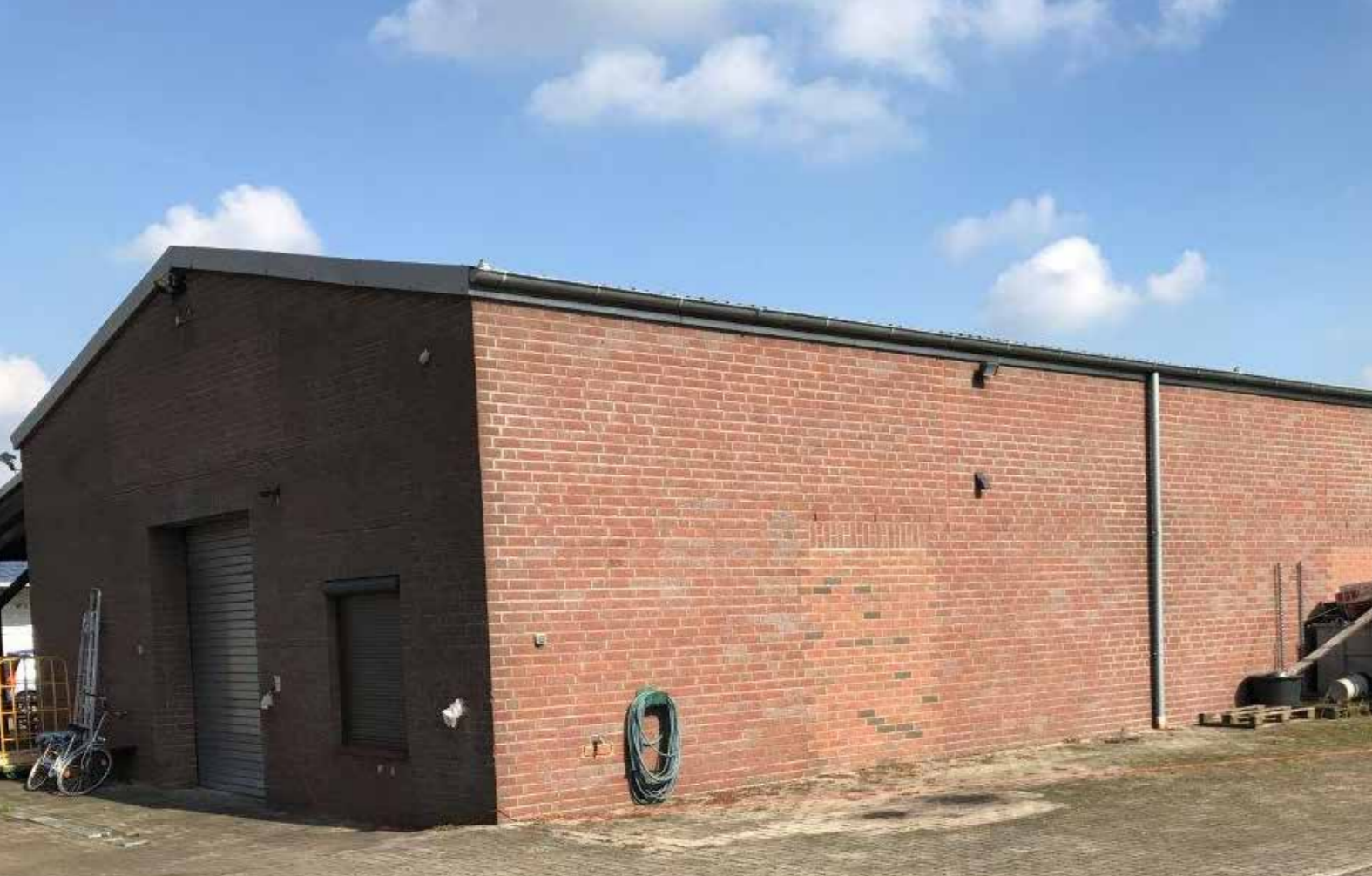
Vor Baubeginn // Mietobjekt