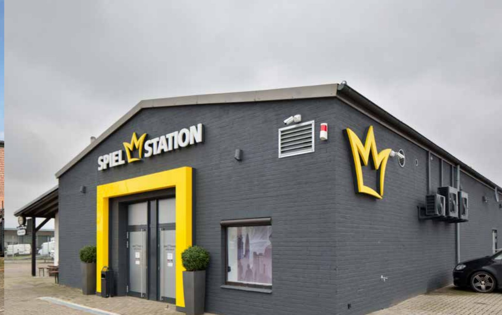
Nach der Eröffnung im Juli 2018